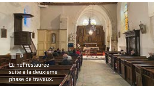
La nef restaurée suite à la deuxième phase de travaux.

Édifiée au XII e siècle, l'église Saint-Denis est dédiée à saint Escobille et à saint Nicaise. Elle est remarquable par son clocher à flèche polygonale en pierre, par le maître-autel, par son retable de la fin du XVII e siècle, ainsi que les bancs en bois, les stalles et le banc d'œuvre, qui sont remarquablement conservés.