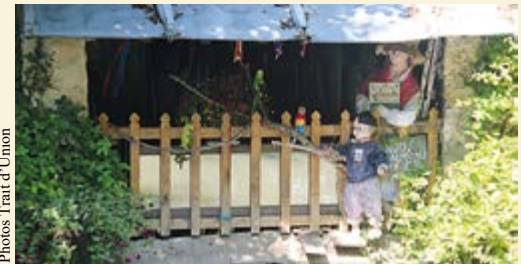
Concours des lavoirs du bord de l'Orge.

http://apaviedourdan.free.fr ; https://dourdanenvironnement.wordpress.com/ http://www.dourdan-transition.fr https://www.grainesdecolibri.org